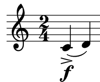
Figure 2. Une liaison de phrasé qui arrive au même moment qu'une indication de nuance et un symbole d'articulation.

A l'intérieur de ce constat se trouve de nombreuses relations – tête de note et articulation, tête de note et liaison de phrasé, tête de note et liaison, liaison et articulation etc. Un modèle relationnel permet d'englober plusieurs règles du même genre sans hiérarchiser les rapports entre les objets. Par exemple, on ne précise pas qu'une articulation fait