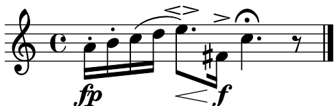
Figure 1. Syntaxe d'entrée de GNU LilyPond et la partition à laquelle le texte conduit une fois compilé.

\relative c'' { a16-. \fp [ b-. c ( d ] e8. \espressivo \< [ fis,16->\f ] c'4. \fermata r8 \bar "|." }